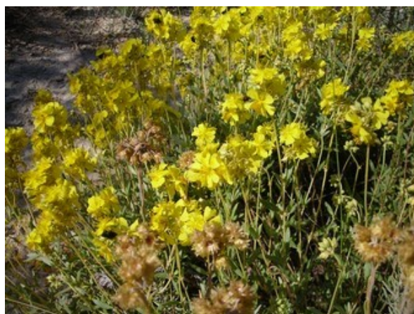
Ononis tridentata subsp. angustifolia (esquerra) i Helianthemum squamatum (dreta) són dos gipsòfits característics de l'hàbitat 1520 i que estan presents a la microreserva.