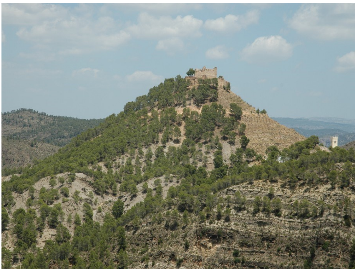
Vista general de la microreserva en la qual s'observa la coberta de pins blancs ( Pinus halepensis ) a partir de les plantacions realitzades fa unes dècades, davall de la qual es troba la brolla gipsícola.