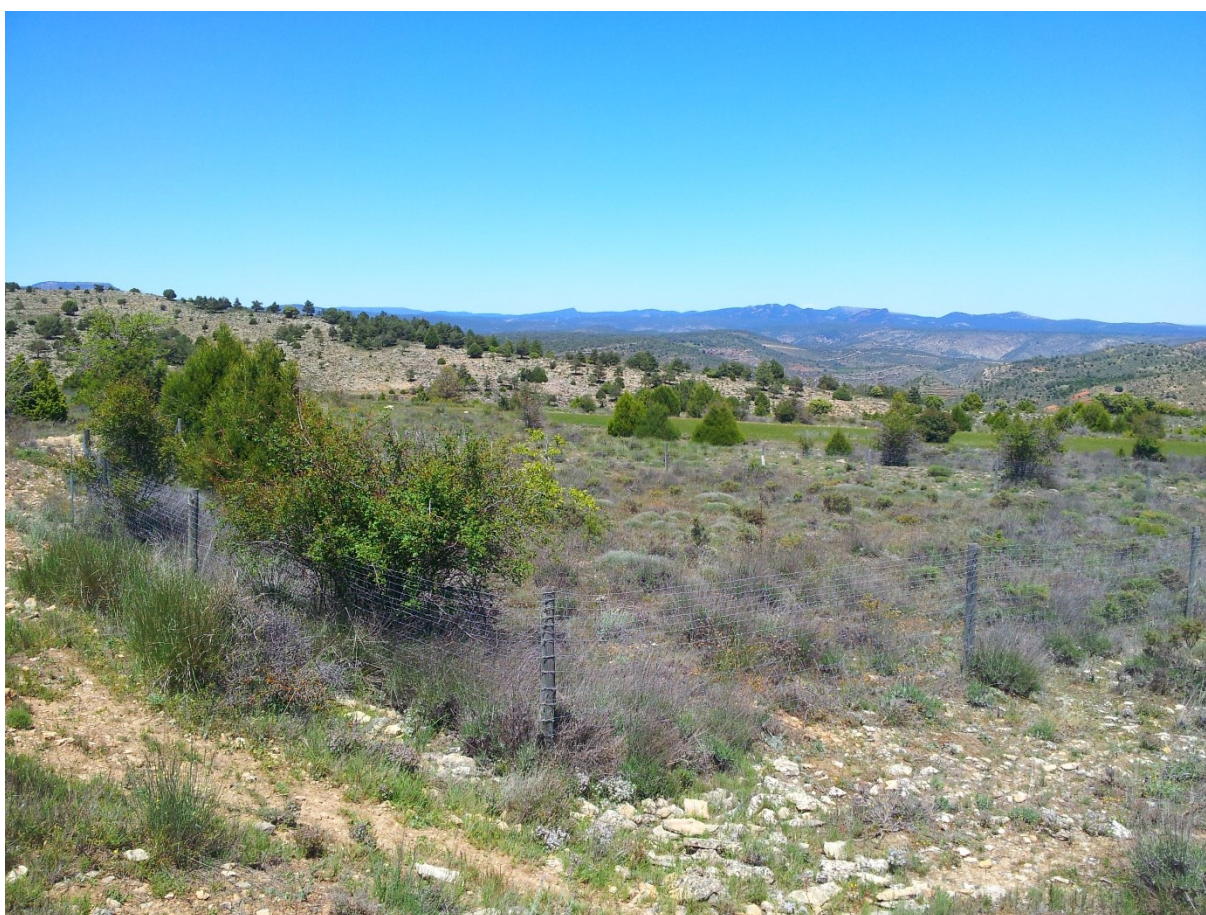
Vista general de la microrreserva, en la que se aprecia la valla instalada para evitar la caída accidental de algún animal en la cavidad donde crece la especie Phyllitis scolopendrium .