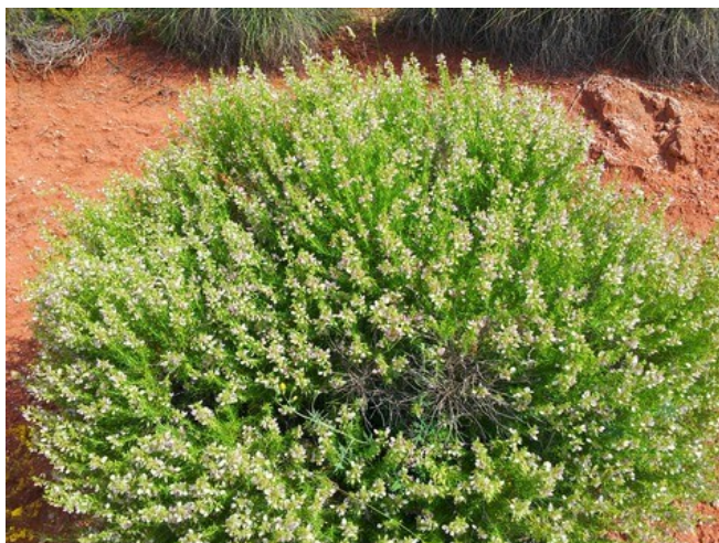
Limonium cofrentanum (izquierda) y Ononis tridentata subsp. angustifolia (arriba) son dos gipsófitos endémicos presentes en la microrreserva.

Tipos de hábitats (Código Natura 2000) (Hábitats prioritarios*)