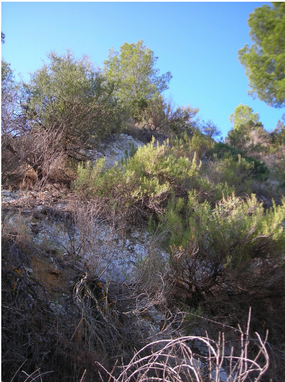
Imatge de la brolla gipsícol·la característica de la vegetació de la microreserva en un vessant de l'embassament d'Embarcaderos.