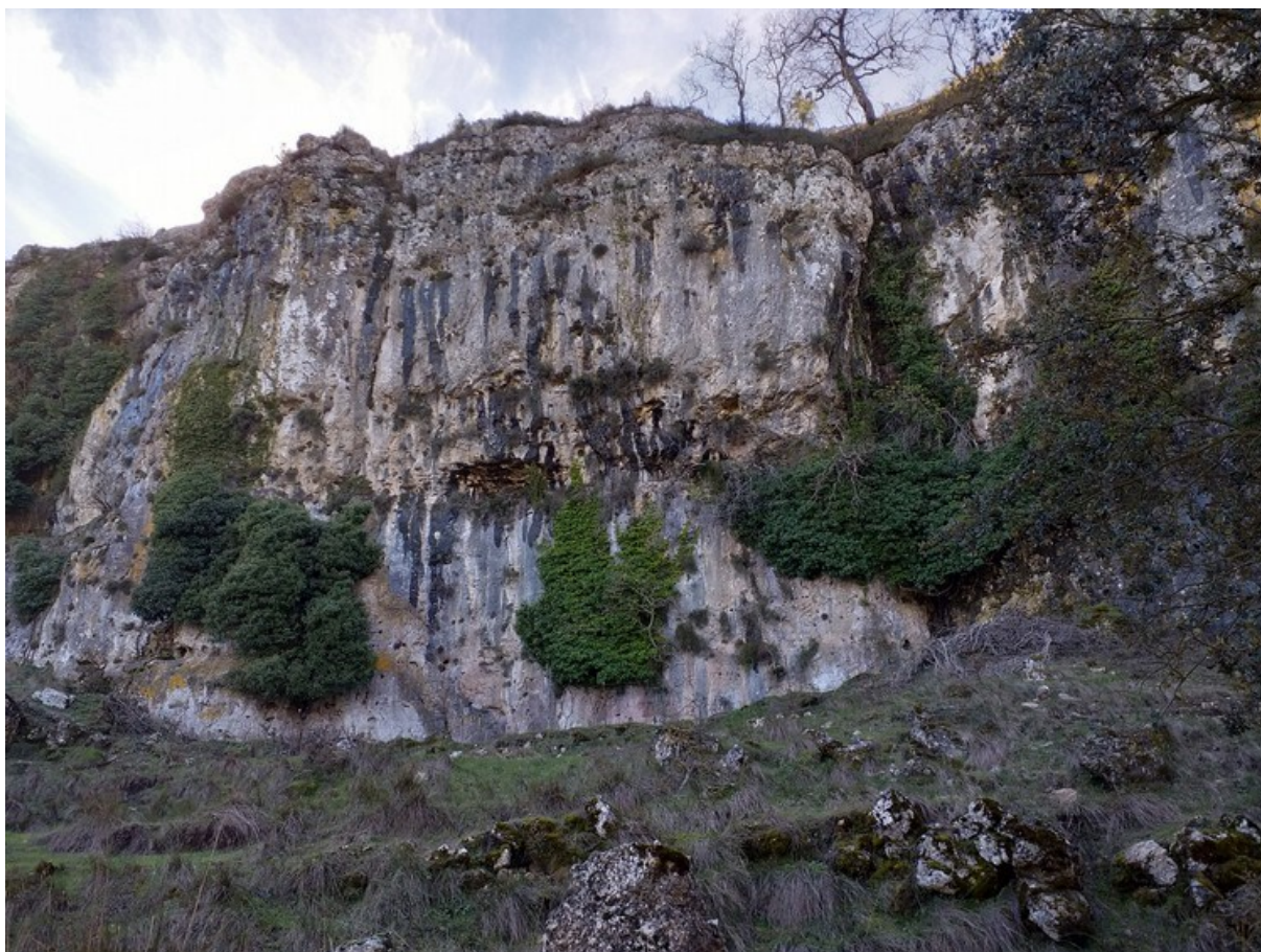
Vista de la microreserva en la qual s'observa l'hàbitat rupícola i l'aspecte del prat que hi ha en la base del cingle.