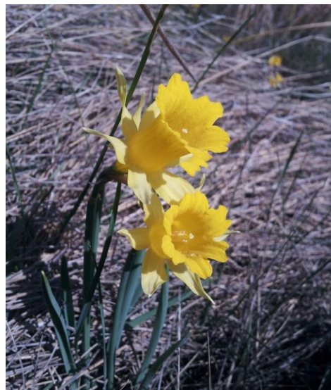
Sternbergia colchiciflora és una de les plantes més destacades de la microreserva (esquerra). Flors de l'espècie protegida Narcissus pseudonarcissus subsp. eugeniae (dreta).