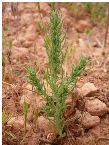
Dianthus broteri subsp. valentinus (izquierda) es un endemismo iberolevantino, mientras que Thesium humile (derecha) es una planta considerada rara, propia de ambientes con ombroclima seco.