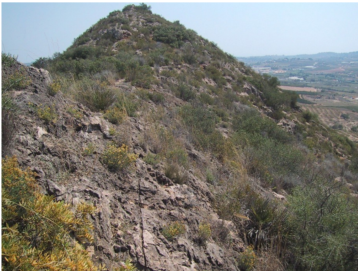
Zona de la carena del Castellet, amb vegetació de brolla i abundants afloraments de roca en la qual és molt comú el cor de penya ( Hypericum ericoides subsp. ericoides ).