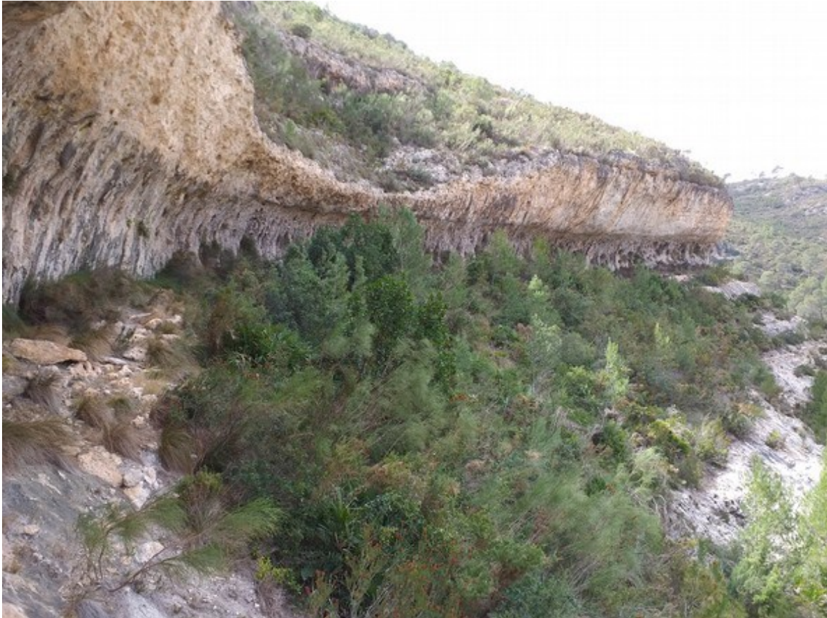
Vista de los abrigos por donde gotea agua que constituyen el hábitat 7220 donde crece la especie endémica Pinguicula saetabensis .