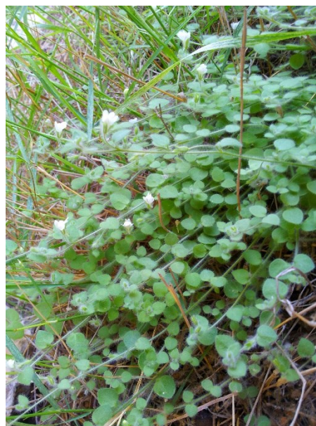
Chaenorhinum tenellum es un endemismo muy característico de la ZEC Serra d'Enguera.