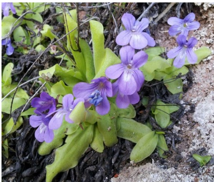
Pinguicula saetabensis es la especie más relevante de la microrreserva, endémica de unas pocas localidades situadas entre Enguera y Moixent.