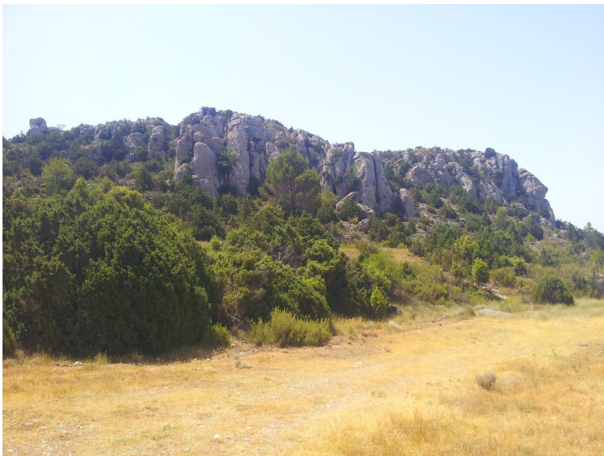
Vista d'una part del Molón, en la qual s'observen els penyals calcaris, al peu dels quals hi ha bones formacions de diverses espècies del gènere Juniperus , que corresponen a l'hàbitat 5210.