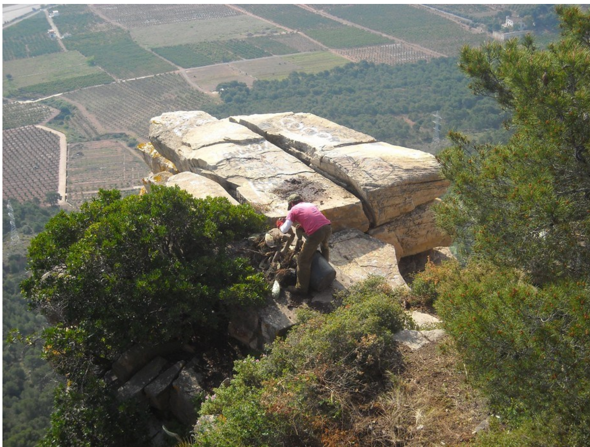
Vista de la parte alta del Picaio en la que se observa un operario de la brigada que realiza trabajos de eliminación de la especie exótica invasora Opuntia ficus-indica .