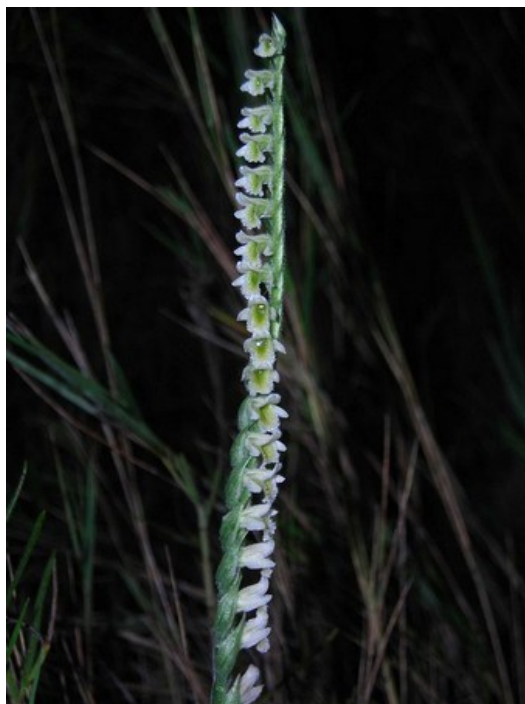
Spiranthes spiralis és una de les orquídiess protegides que es pot observar a la microreserva.

Ophrys speculum (R) Orchis anthropophora (P, R) Paronychia aretioides (E) Paronychia suffruticosa (E) Pteris vittata (P, R) Rhamnus borgiae (E) Rhamnus lycioides (E) Satureja obovata subsp. valentina (E) Selaginella denticulata (R) Spiranthes spiralis (P, R) Teucrium botrys (R) Teucrium buxifolium subsp. buxifolium (E, R) Teucrium ronnigeri subsp. ronnigeri (E) Thymus piperella (E) Thymus vulgaris subsp. aestivus (E) Trisetum velutinum (E, R)