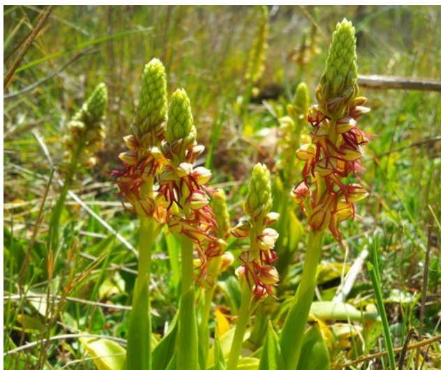
Orchis anthropophora és una orquídiess inclosa en la categoria d'espècies Vigilades .