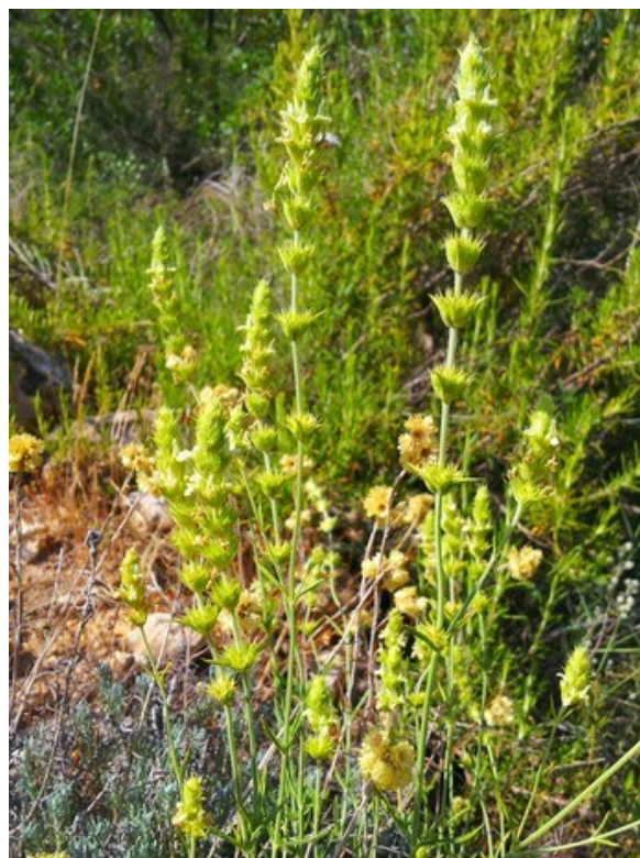
Sideritis tragoriganum subsp. tragoriganum , un endemismo iberolevantino que forma parte del hábitat 5330.