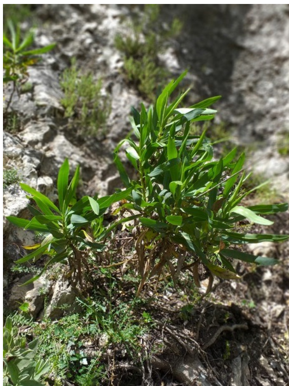
Bupleurum gibraltarium es una planta incluida en la categoría de especies Vigiladas .

Muscari atlanticum (R) Odontites recordonii (E) Reseda valentina (E) Rhamnus borgiae (E) Rhamnus lycioides (E) Satureja intricata subsp. gracilis (E) Scrophularia tanacetifolia (E) Sideritis tragoriganum subsp. tragoriganum (E) Teucrium buxifolium subsp. buxifolium (E, R) Teucrium ronnigeri subsp. ronnigeri (E) Thymus piperella (E)