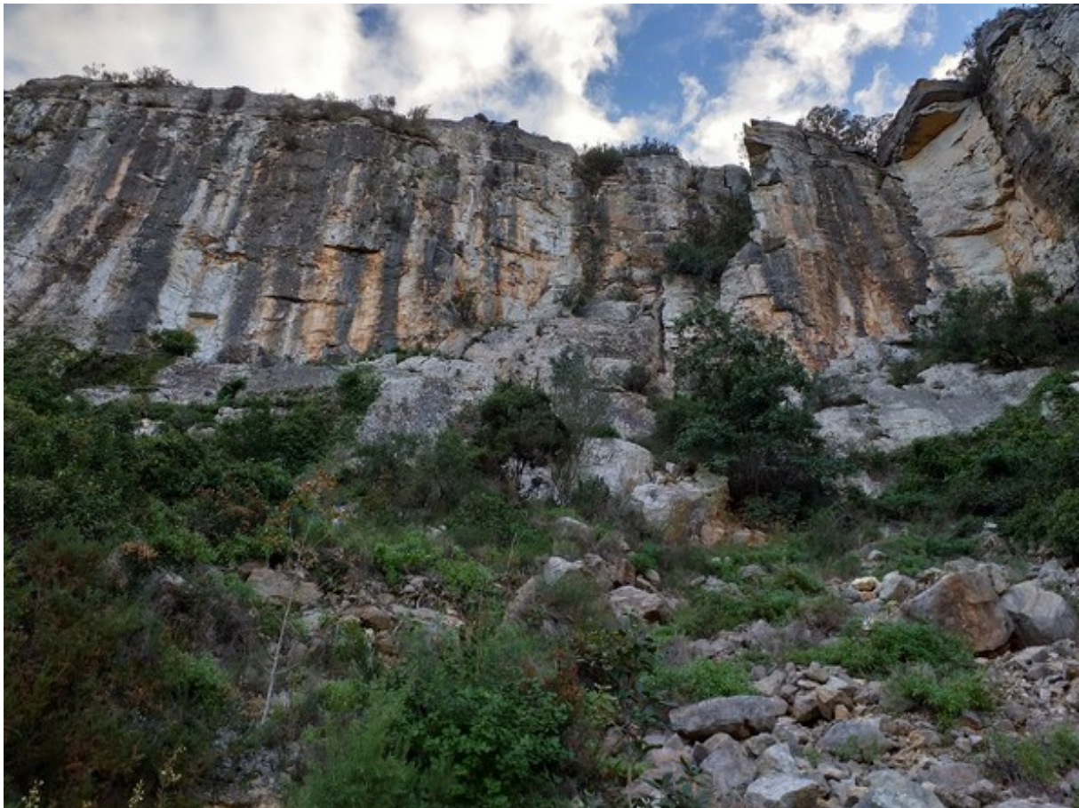
Vista de l'hàbitat rupícola on creix l'espècie endèmica Antirrhinum valentinum .

http://www.docv.gva.es/datos/2001/01/30/pdf/2001_674.pdf