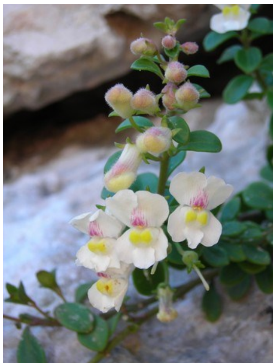
Detall de les flors d' Antirrhinum valentinum , endemisme exclusiu del massís del Mondúver i serres pròximes.

Phlomis purpurea (E) Pseudoscabiosa saxatilis (E) Pulicaria odora (R) Reseda valentina (E) Rhamnus borgiae (E) Rhamnus lycioides (E) Salvia valentina (E, R) Sarcocapnos saetabensis (E) Satureja obovata subsp. valentina (E) Scrophularia tanacetifolia (E) Selaginella denticulata (R) Stachys officinalis (R) Teucrium buxifolium subsp. buxifolium (E, R) Teucrium ronnigeri subsp. ronnigeri (E) Thymus piperella (E) Trisetum velutinum (E, R)