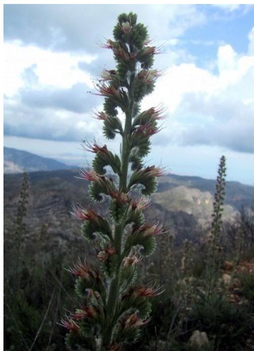
Inflorescència d' Echium flavum subsp. saetabense , endemisme del sector Setabenc inclòs en la categoria d'espècies Protegides No Catalogades .