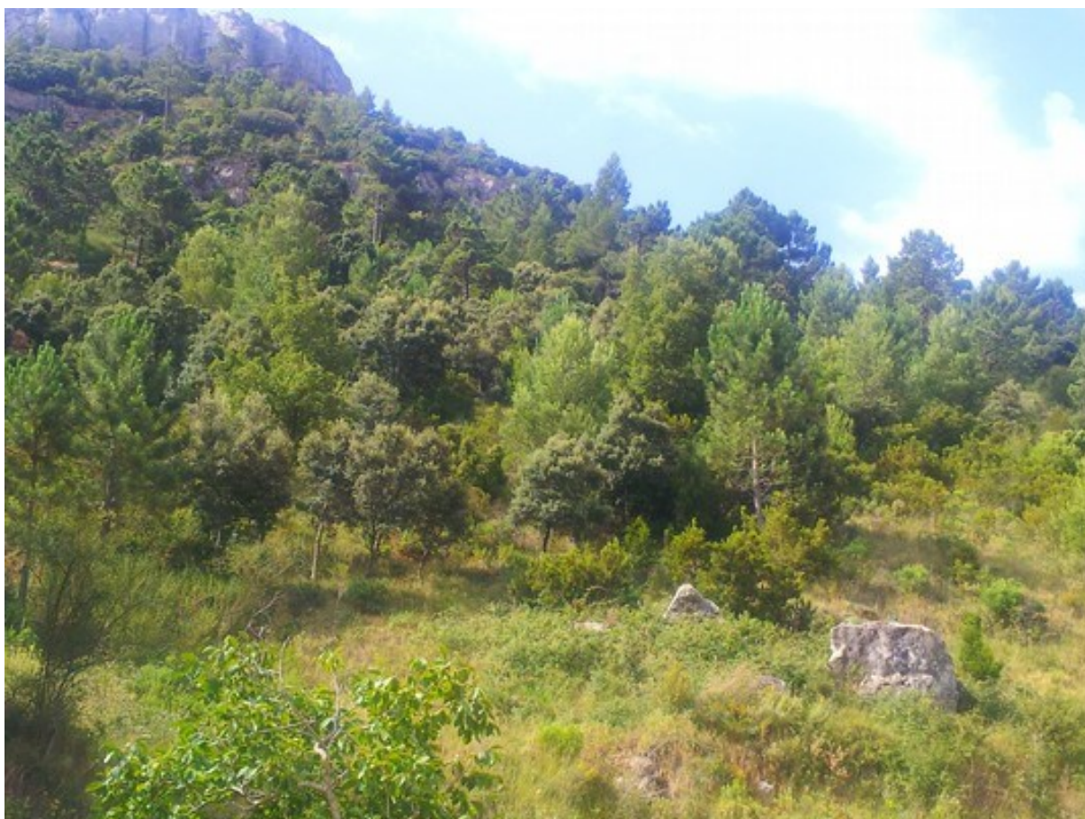
Vista de la microrreserva desde la parte inferior en la que se observa el hábitat rupícola y el del bosque de encina ( Quercus ilex subsp. rotundifolia ).