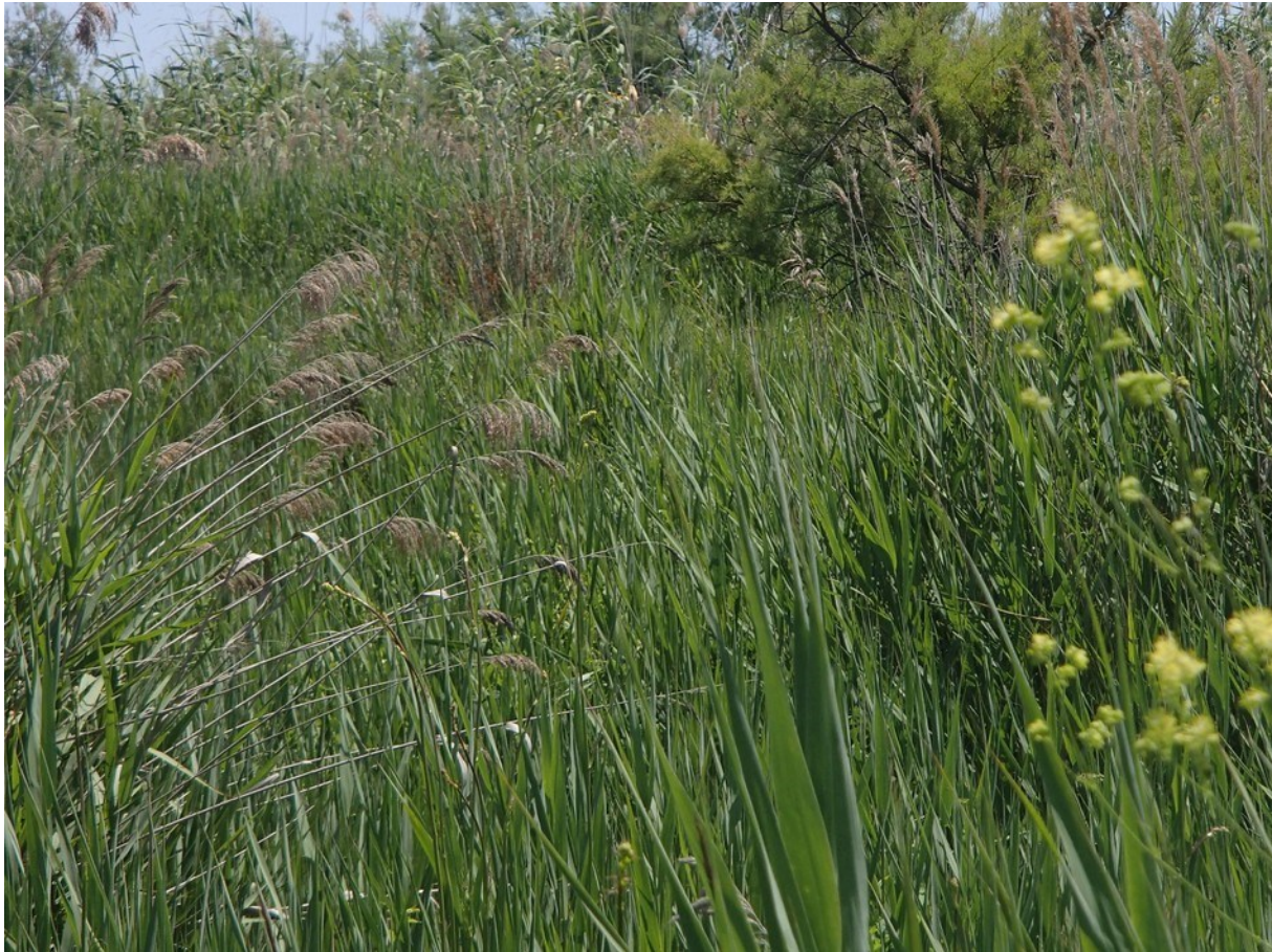
Aspecto de la vegetación de la microrreserva, dominada por la comunidad de carrizo ( Phragmites australis ).