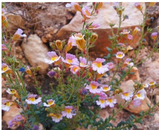
Paronychia suffruticosa (izquierda) y Chaenorhinum crassifolium subsp. crassifolium (derecha) son dos de los endemismos que se pueden encontrar en la microrreserva.