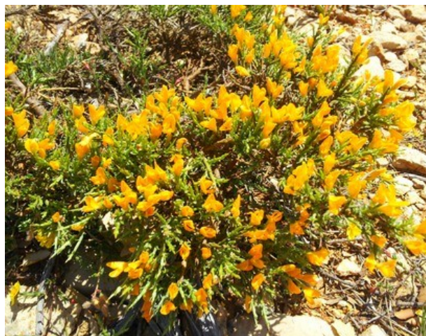
Thymus piperella (izquierda) y Genista pumila subsp. pumila (derecha) son dos de los endemismos que se pueden encontrar en la microrreserva.