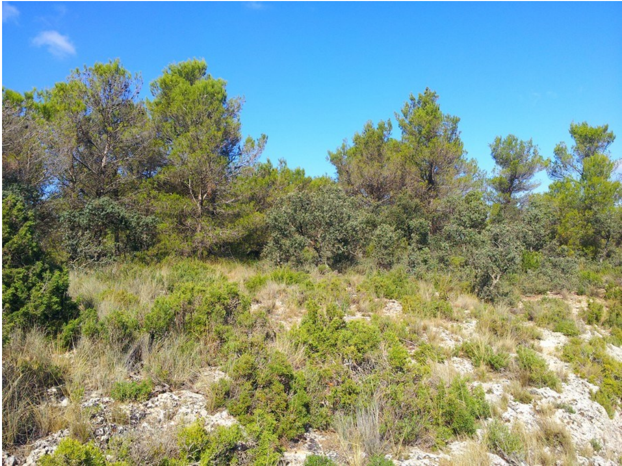
El matoll amb pi blanc ( Pinus halepensis ) és la vegetació característica de la microreserva.