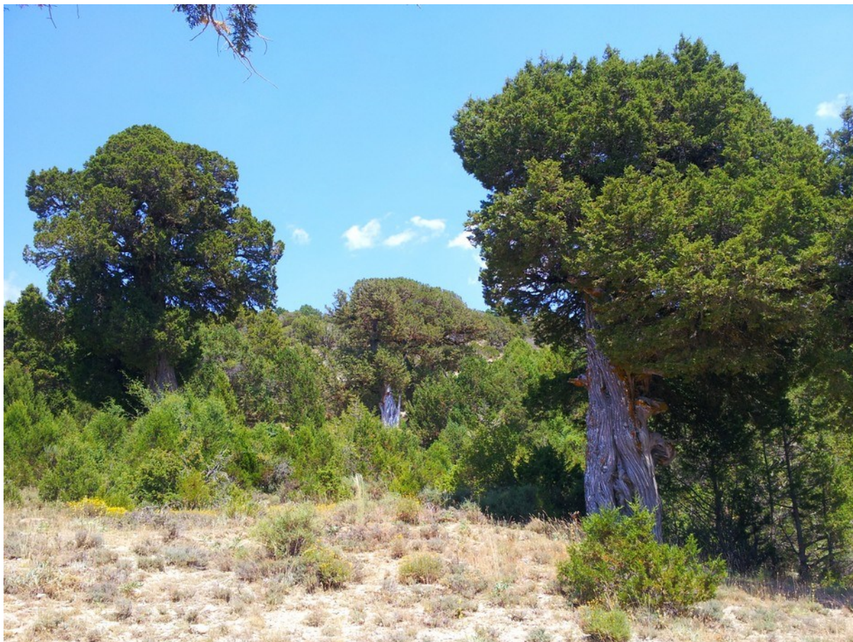
Imatge de la microreserva en la qual es veu una bona representació de l'hàbitat Boscos endèmics de Juniperus spp.