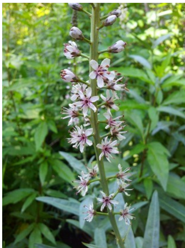
Equisetum telmateia (esquerra) i Lysimachia ephemerum (dreta) són dues plantes característiques d'alguns dels hàbitats presents a la microreserva.