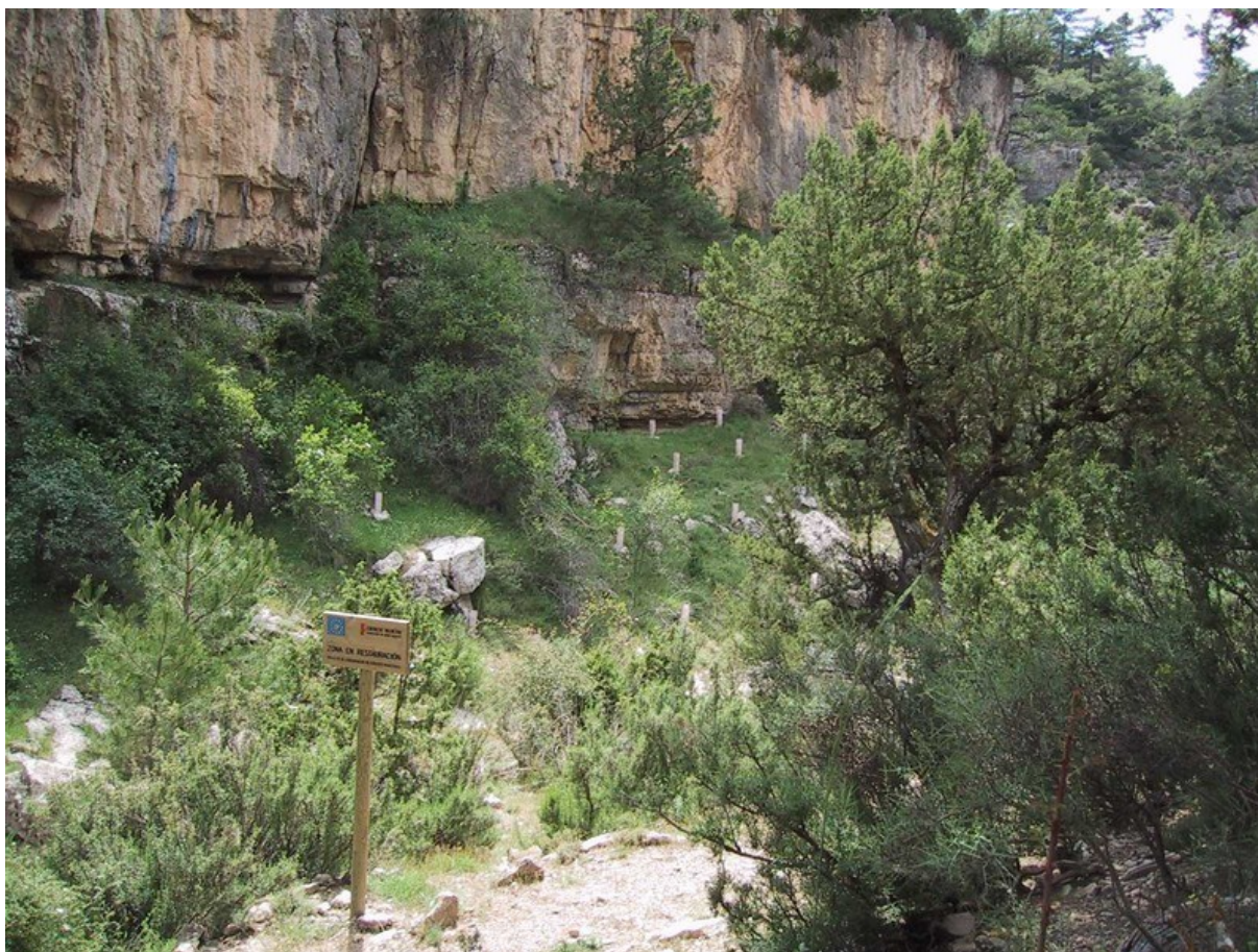
Vista de la microrreserva en la que se observa una de las plantaciones que se han realizado aprovechando las condiciones de especial humedad del interior del barranco.