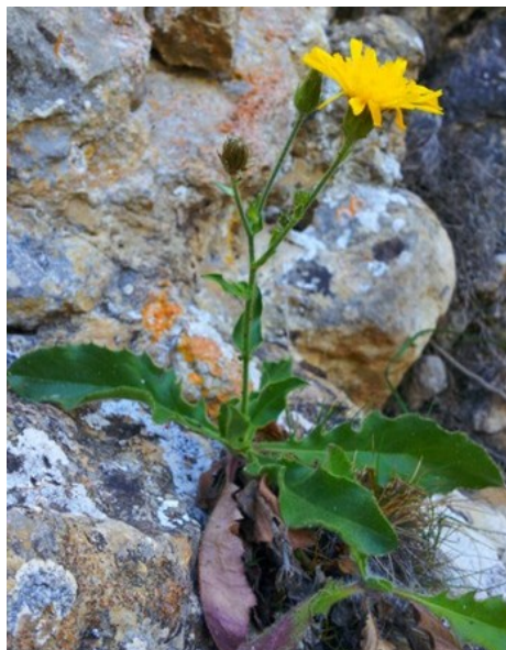
Hyssopus officinalis subsp. canescens (izquierda) y Hieracium amplexicaule (derecha) son dos de las especies raras que se pueden observar en la microrreserva.

Tipos de hábitats (Código Natura 2000) (Hábitats prioritarios*)