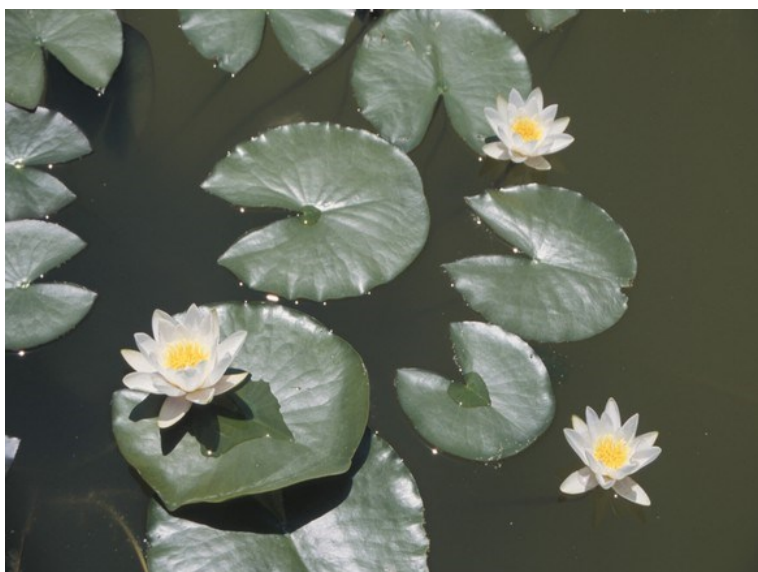
Nymphaea alba es una de las especies protegidas que se introdujo en la microrreserva tras las obras de remodelación.