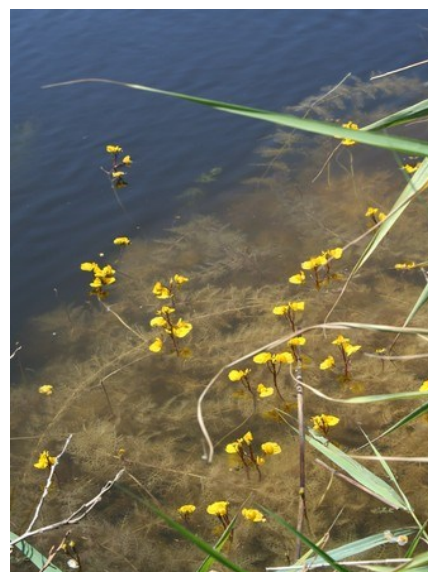
Utricularia australis es una especie incluida en la categoría En Peligro de Extinción del Catálogo Valenciano de Especies de Flora Amenazadas.