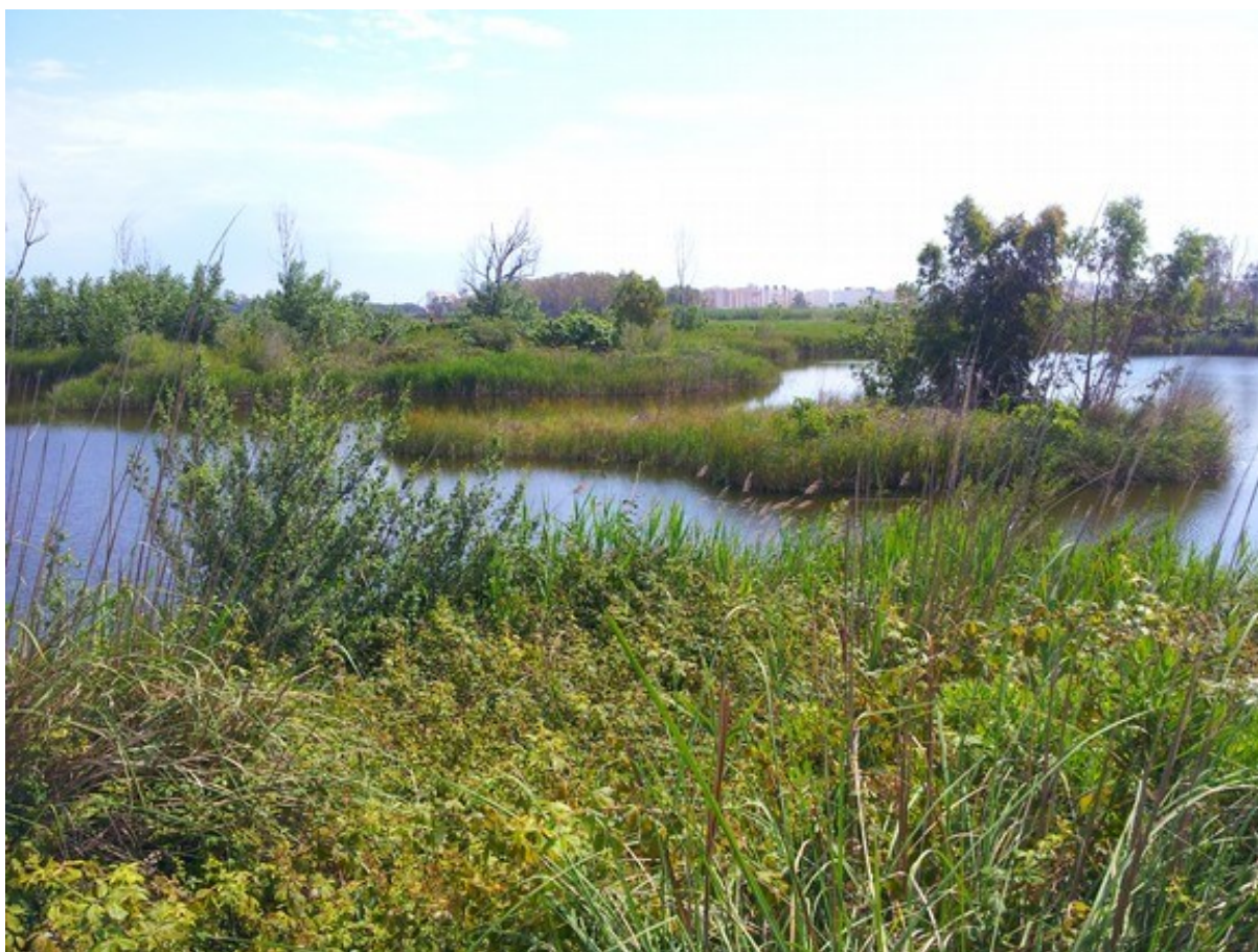
Vista de la microrreserva con el aspecto tras las obras de remodelación, en la que se aprecian las lagunas que constituyen el hábitat 7210.