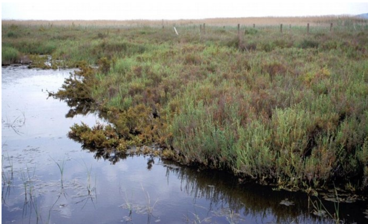
Aspecto de la microrreserva con zonas que se inundan y otras donde se desarrolla la comunidad de saladar, dominada por la especie Arthrocnemum macrostachyum .