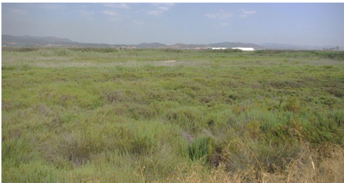
Aspecto de la comunidad de saladar, que ocupa una parte importante de la superficie de la microrreserva, con dominio de la especie Arthrocnemum macrostachyum .