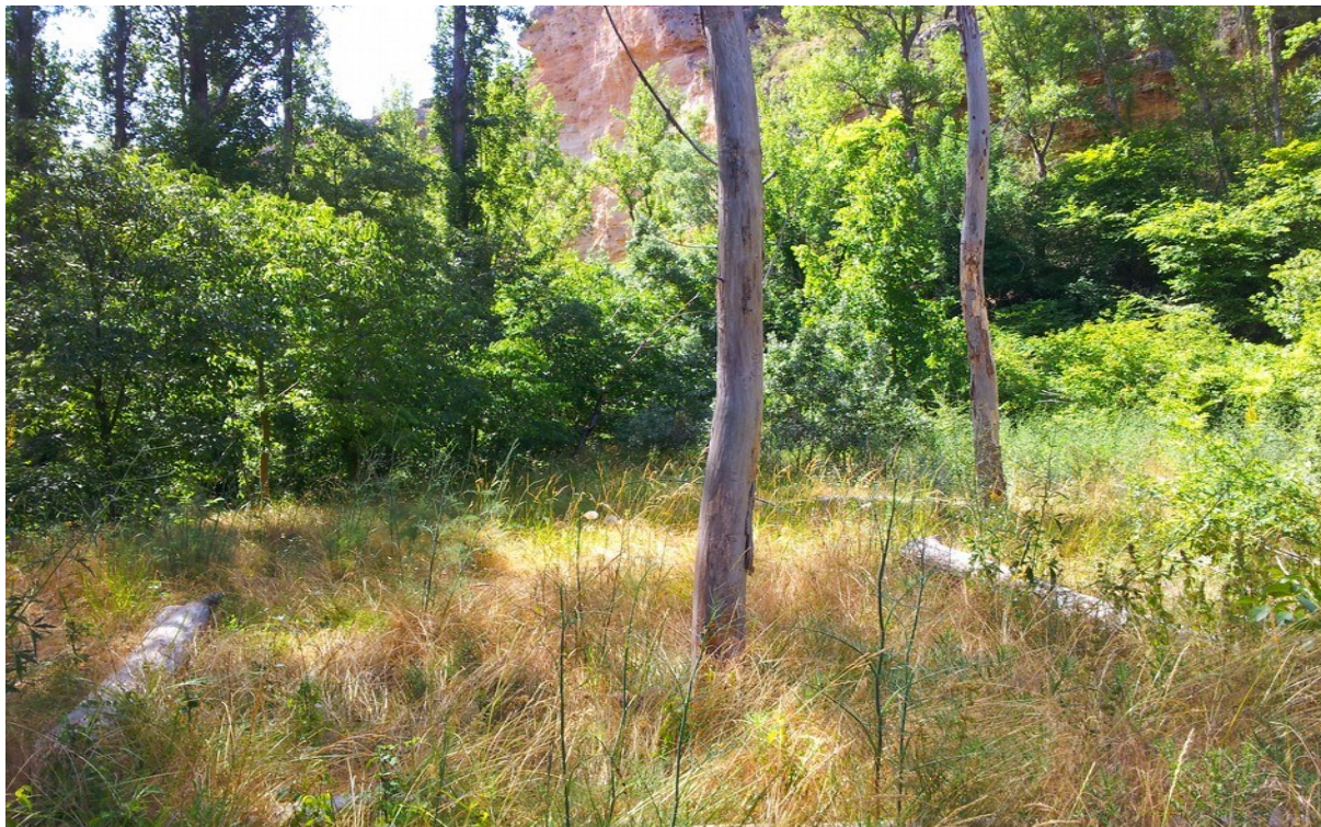
Imagen de una de las dos parcelas que constituyen la microrreserva, en la que se observa la vegetación de ribera creciendo en los bordes y el prado que se encuentra ocupando más superficie de la parcela, con algunos troncos de chopo ( Populus nigra ) muertos. En el fondo se aprecia uno de los taludes del río Ebrón.

http://www.docv.gva.es/datos/2006/09/11/pdf/2006_10252.pdf