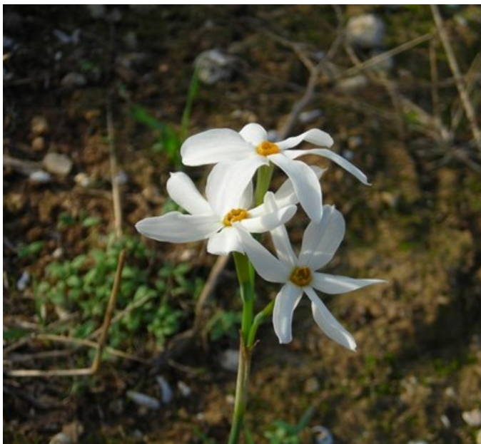
Narcissus obsoletus es una de las especies raras de la microrreserva que crece en el hábitat 6110.