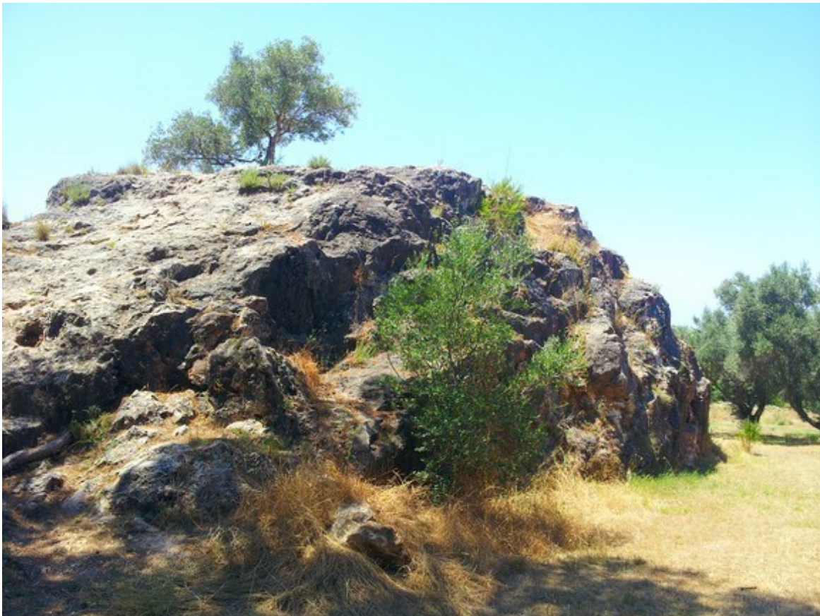
Vista de uno de los afloramientos de roca de la microrreserva donde aparece el hábitat 6110.