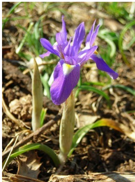
Gynandris sisyrinchium es otra planta rara en la flora valenciana y que se puede encontrar en la microrreserva.