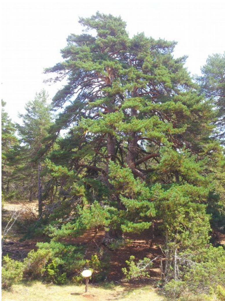
Imagen del ejemplar de pino albar ( Pinus sylvestris ) conocido con el nombre de pino de Vicente Tortajada , con sus tres troncos, sin duda el elemento más característico y que da nombre a la microrreserva.