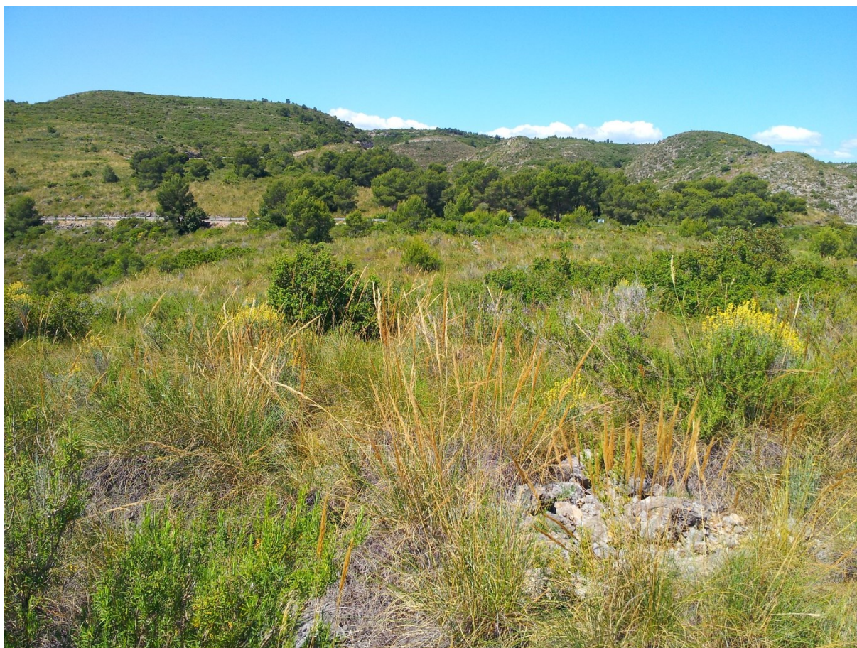
Imatge de la microreserva en la qual s'observa l'aspecte de la brolla calcícola.