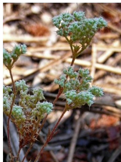
Población de la especie protegida Ophioglossum lusitanicum creciendo en un claro del matorral (izquierda) y Chaetonychia cymosa , una de las especies protegidas que también se pueden encontrar en la microrreserva creciendo sobre terrenos arenosos (derecha).