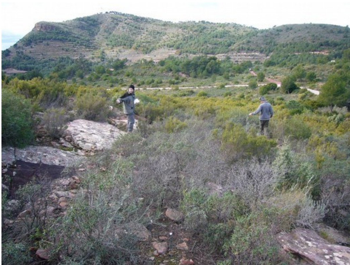
Imagen general de la microrreserva en la que se aprecia la comunidad arbustiva durante el marcado de los técnicos para el censo poblacional de la especie Ophioglossum lusitanicum .