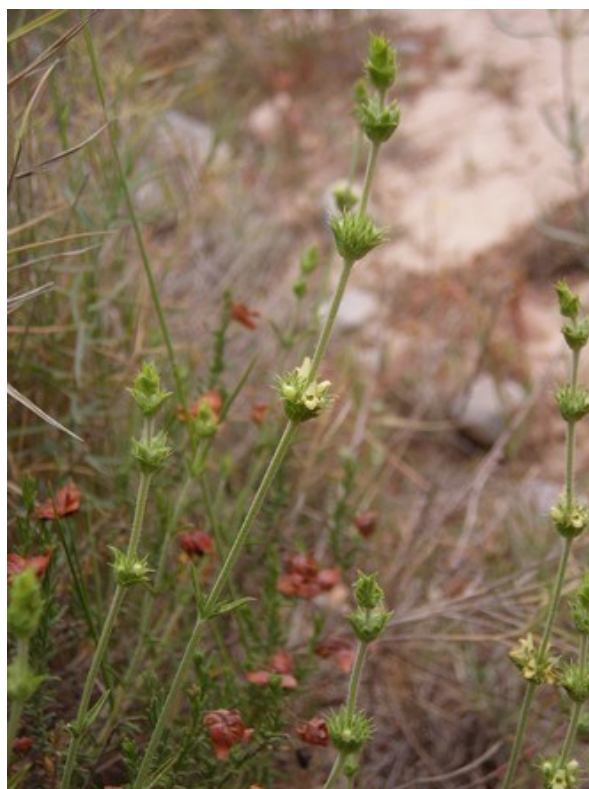
Biscutella calduchii (esquerra) y Sideritis tragoriganum subsp. juryi (dreta) són dos dels endemismes que es poden observar en aquesta microreserva.

Tipus d'hàbitats (Codi Natura 2000) (Hàbitats prioritaris*)