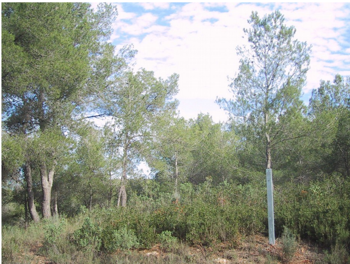
Vista de la microreserva en la qual es pot observar la formació de pi blanc ( Pinus halepensis ).