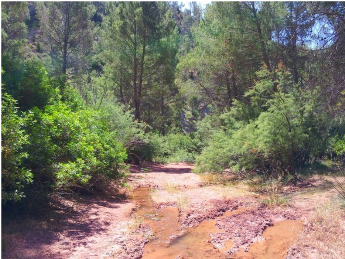
Vista de la rambla amb la formació de Tamarix gallica sobre algeps, amb el to rogenc característic d'aquest tipus de material.