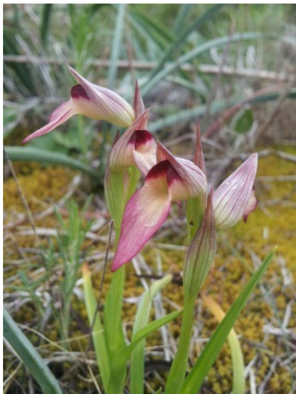
Serapias lingua es una especie incluida en la categoría Protegida no catalogada.