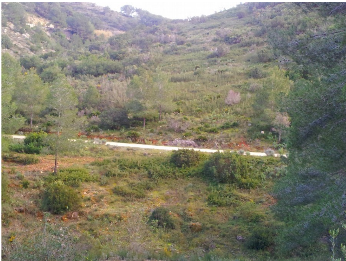
Vista general de la microreserva que representa un vessant on predomina la vegetació de brolla calcícola amb clars on apareix l'hàbitat 6220.