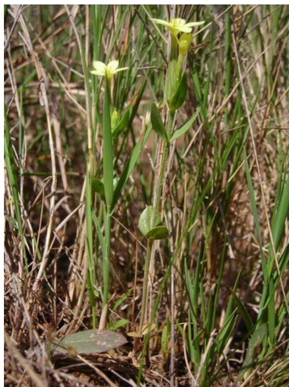
Centaurium maritimum és una espècie considerada rara en la flora valenciana i que creix en clars sobre sòls descarbonatats.