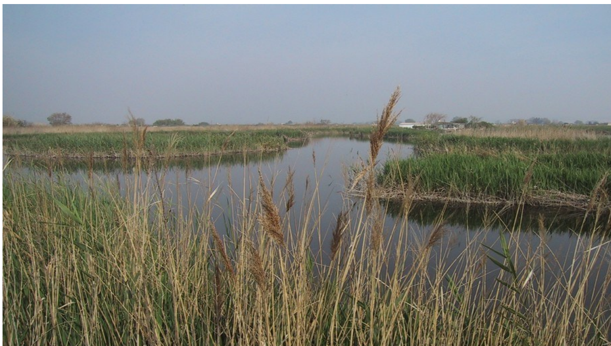
Imatge de la microreserva en la qual es pot observar la làmina d'aigua de l'hàbitat de 7210 Torberes calcàries.