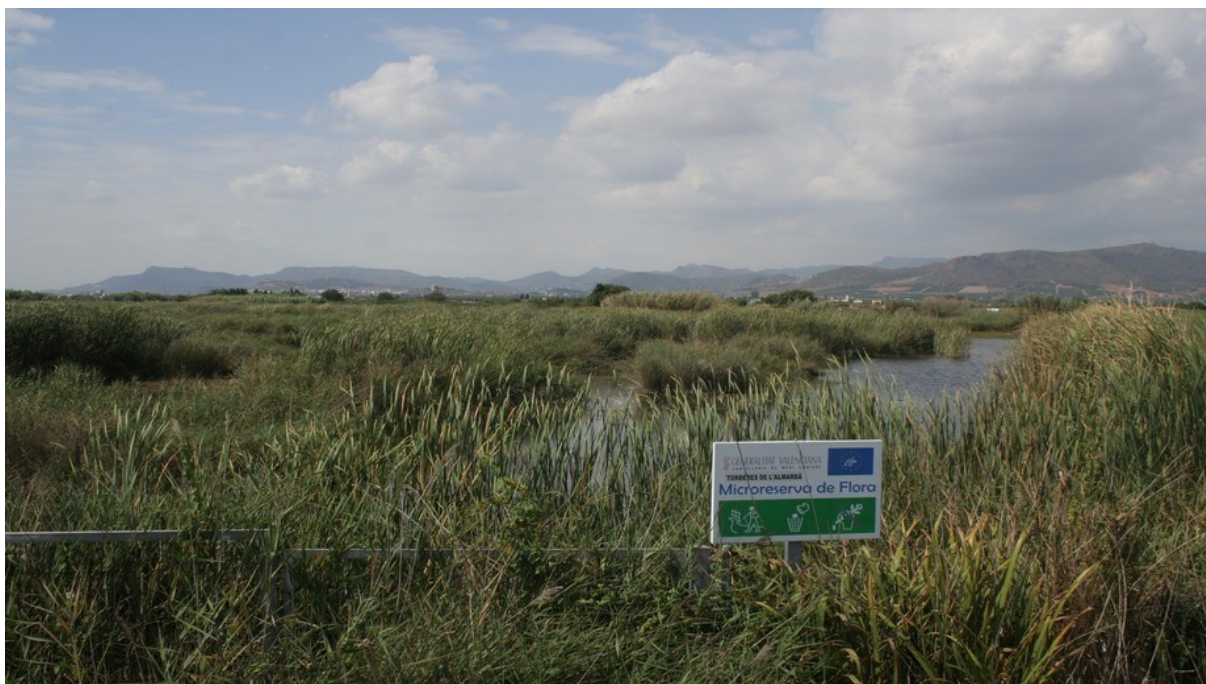
Vista general de la microrreserva, en la que se observa el hábitat de turberas calcáreas.