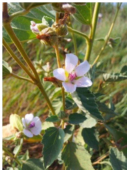
Myriophyllum spicatum (izquierda) y Althaea officinalis (derecha) son dos especies de la microrreserva consideradas raras en la flora valenciana.

Tipos de hábitats (Código Natura 2000) (Hábitats prioritarios*)