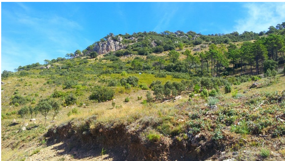
Vista general de la microreserva, amb l'hàbitat rupícola a la part superior.