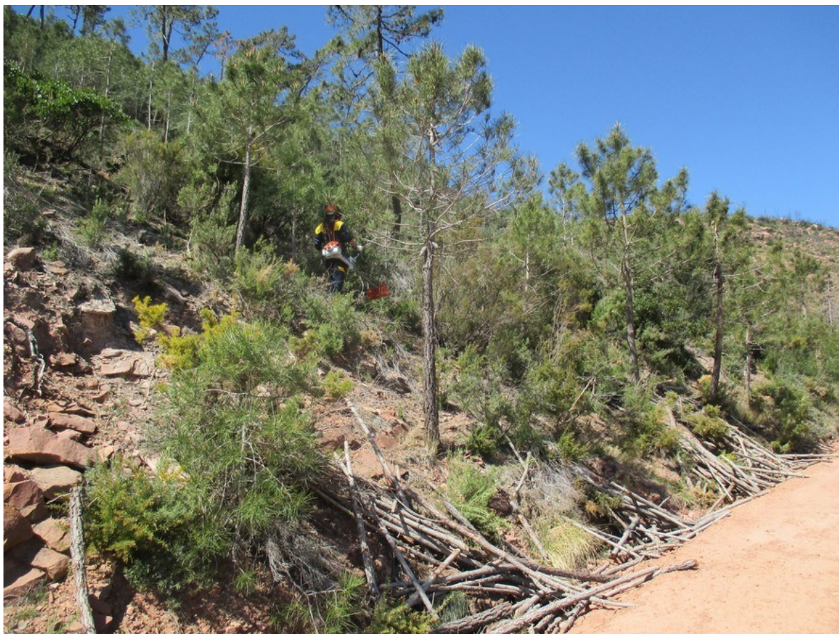
Imatge en la qual es pot apreciar l'aspecte de la microreserva durant les tasques silvícoles d'aclarida i poda del pinar dutes a terme per la brigada Natura 2000 de València nord.