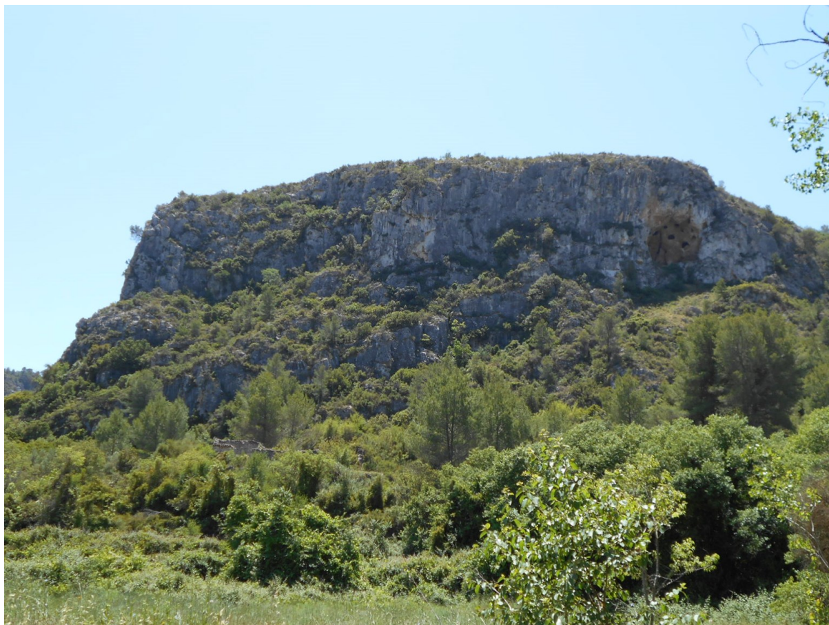
Vista de la microreserva on s'observen les comunitats rupícoles i l'hàbitat de carrasquer.

http://www.dogv.gva.es/datos/2007/01/16/pdf/2006_14550.pdf