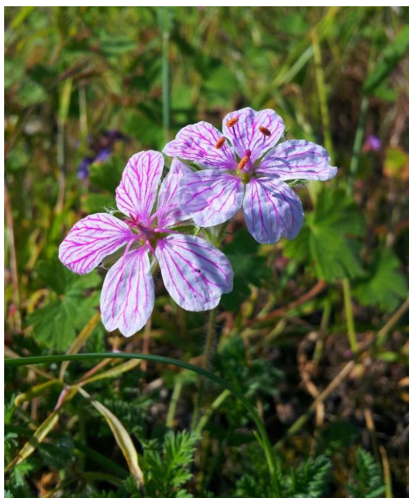
Erodium saxatile es una especie propia de las zonas rocosas cacuminales de las montañas alcoyano-diánicas.

Guillonea scabra (E) Guiraoa arvensis (E, R) Iberis carnosa subsp. hegelmaieri (E) Linaria repens subsp. blanca (E) Ononis fruticosa (E) Onopordum acaulon (R) Paronychia suffruticosa (E) Phleum phleoides (R) Reseda valentina (E) Scrophularia tanacetifolia (E) Sideritis tragoriganum subsp. tragoriganum (E) Silene mellifera (E) Teucrium ronnigeri subsp. ronnigeri (E)