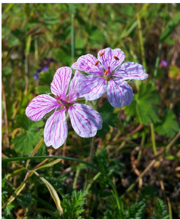
Erodium saxatile és una espècie pròpia de les zones rocoses cacuminals de les muntanyes alcoiano-diàniques.

Guillonea scabra (E) Guiraoa arvensis (E, R) Iberis carnosa subsp. hegelmaieri (E) Linaria repens subsp. blanca (E) Ononis fruticosa (E) Onopordum acaulon (R) Paronychia suffruticosa (E) Phleum phleoides (R) Reseda valentina (E) Scrophularia tanacetifolia (E) Sideritis tragoriganum subsp. tragoriganum (E) Silene mellifera (E) Teucrium ronnigeri subsp. ronnigeri (E)