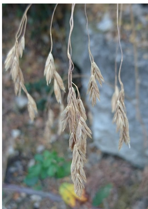
Festuca patula és una gramínia que habita en clars de carrascars.