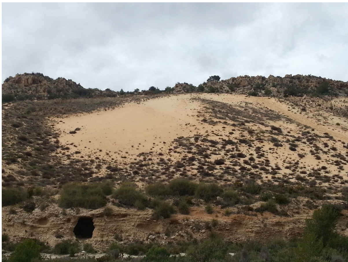
Vista de la microreserva on s'aprecien les comunitats psammòfiles.

http://www.dogv.gva.es/datos/2001/01/30/pdf/2001_670.pdf