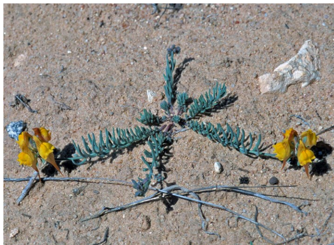
Linaria depauperata subsp. hegelmaieri , endemisme iberollevantí que forma part de pradells psammòfils i que està protegida en la categoria d'espècies Vigilades .