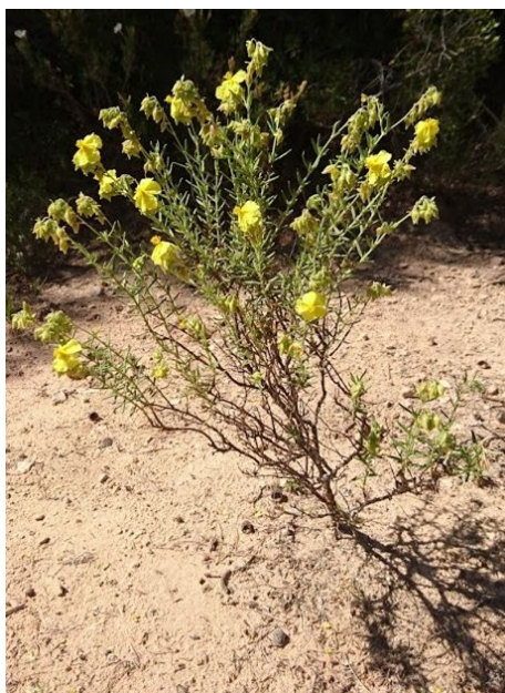
Helianthemum guerrae és un endemisme iberollevantí que creix en formacions arbustives dels arenals d'interior. Està inclosa en la categoria d'espècies Protegides No Catalogades .