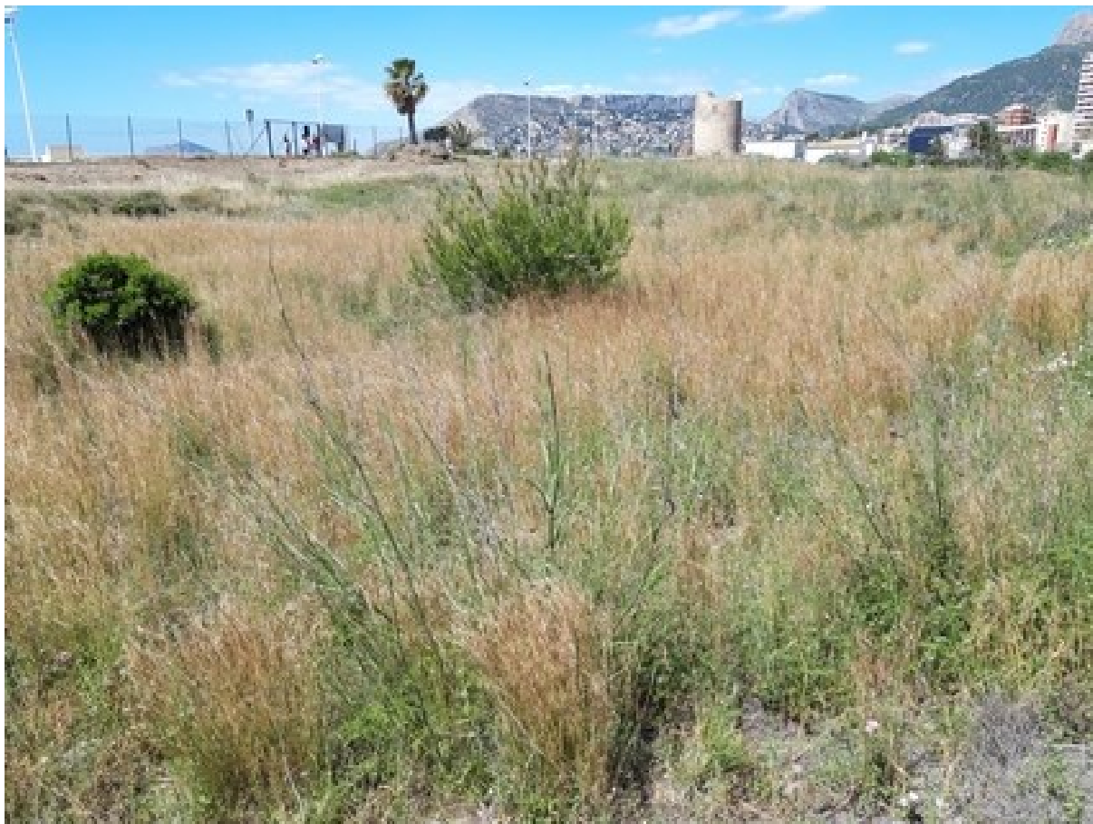
Vista de la microreserva on s'aprecien les comunitats halonitròfiles i psammòfiles.