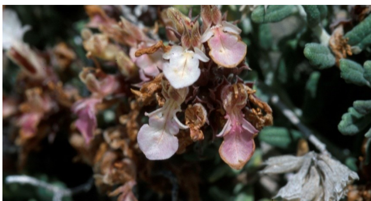
Teucrium buxifolium subsp. rivasii , endemisme valencià que colonitza parets rocoses.