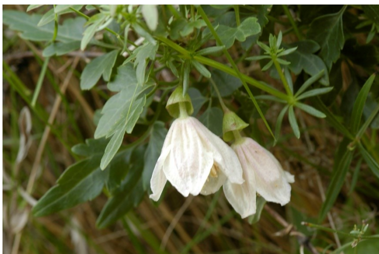
Clematis cirrhosa és una espècie amenaçada pròpia de coscollars i llentiscars litorals.