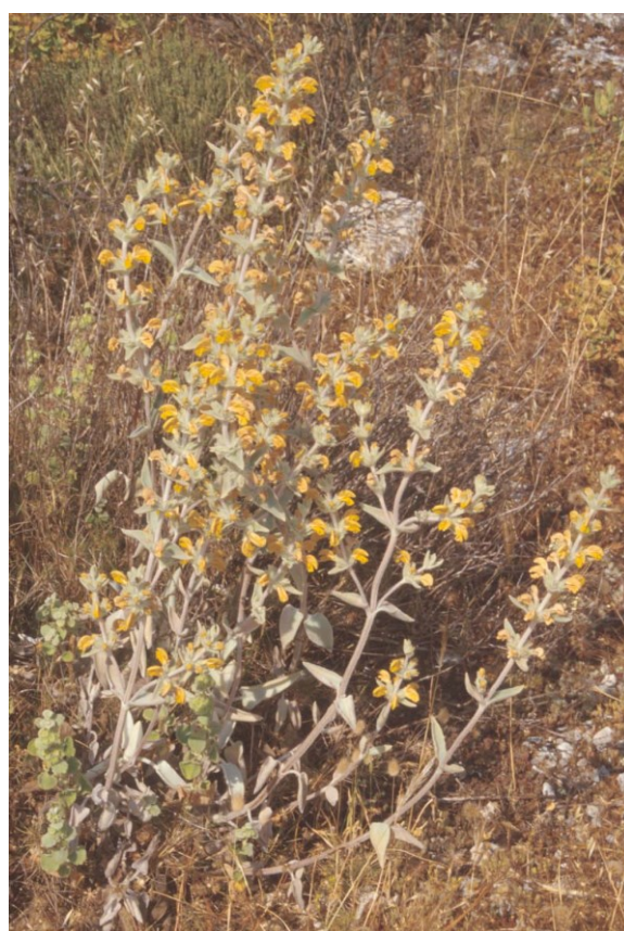
La cresolera ( Phlomis crinita ) és un endemisme iberollevantí característic de les brolles termòfiles calcícoles.