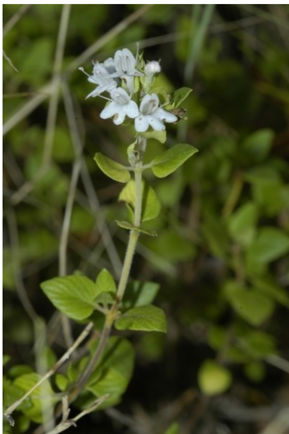
Inflorescència de Thymus richardii subsp. vigoii . És un endemisme exclusiu valencià, considerat com a Vulnerable en el Catàleg Valencià d'Espècies Amenaçades.