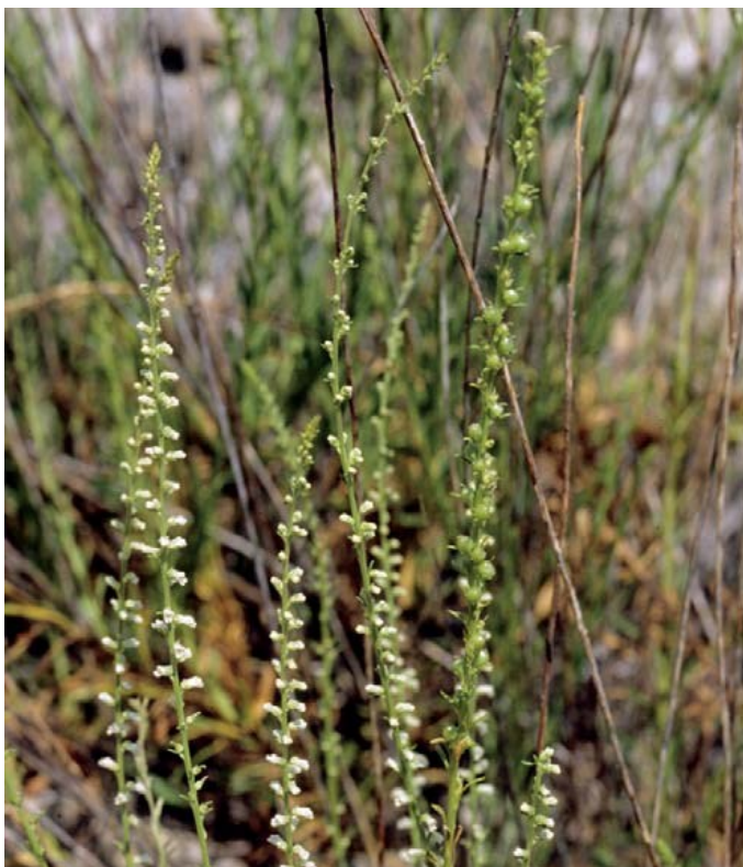
Anarrhinum fruticosum es un endemismo ibero-norteafricano que se encuentra protegido.