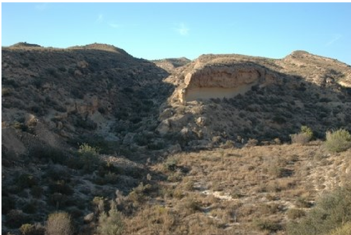
Vista del hábitat de matorrales mediterráneos en mosaico con los pastizales secos.

http://www.dogv.gva.es/datos/2002/12/02/pdf/2002_13219.pdf