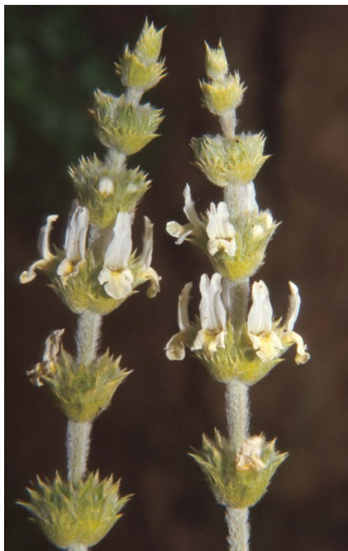
El rabo de gato ( Sideritis leucantha subsp. leucantha ) es un endemismo iberolevantino.