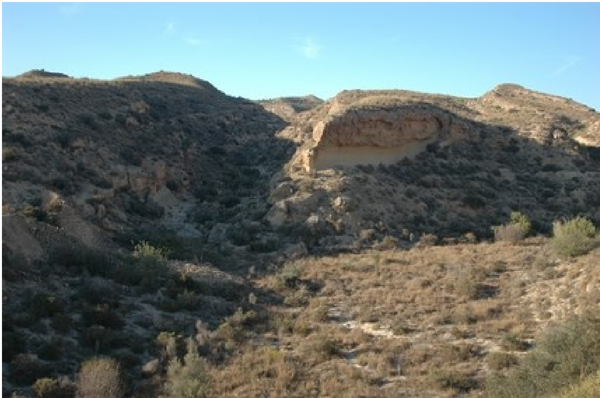
Vista de l'hàbitat de matolls mediterranis en mosaic amb els prats secs.

http://www.dogv.gva.es/datos/2002/12/02/pdf/2002_13219.pdf