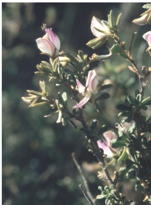
Ononis rentonarensis , endemismo exclusivo de las sierras centrales de la provincia de Alicante.