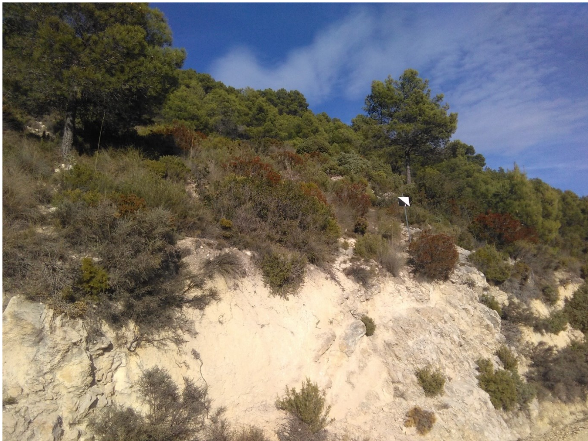
Vista de la microrreserva en la que se observan los ambientes margosos que coloniza la especie Ononis rentonarensis .

http://www.dogv.gva.es/datos/2010/06/10/pdf/2010_6390.pdf