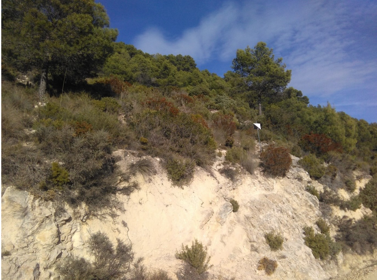
Vista de la microreserva en la qual s'observen els ambients margosos que colonitza l'espècie Ononis rentonarensis .

http://www.dogv.gva.es/datos/2010/06/10/pdf/2010_6390.pdf