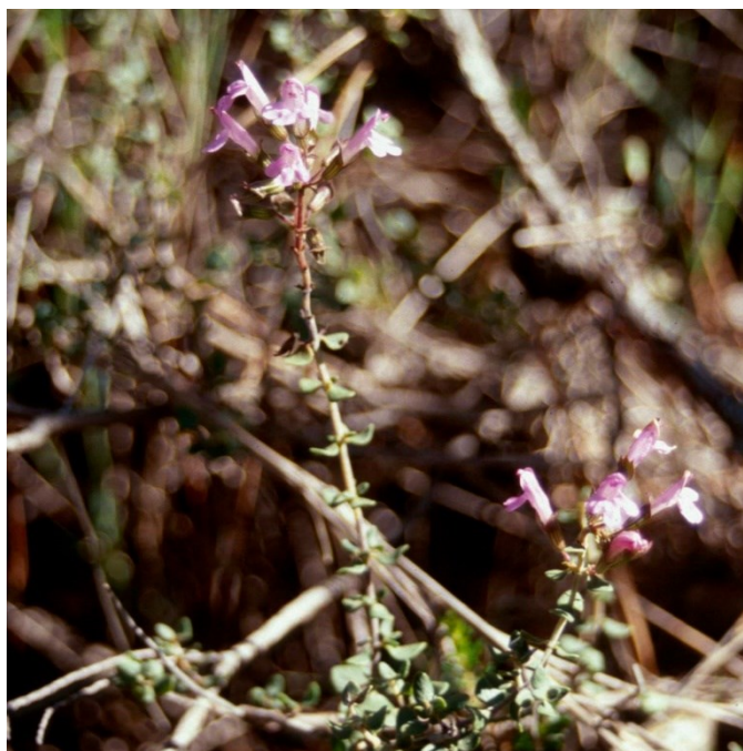
La pebrella ( Thymus piperella ) és una espècie amb la majoria de les poblacions en territori valencià però que també és present en zones limítrofes d'Albacete i Múrcia.