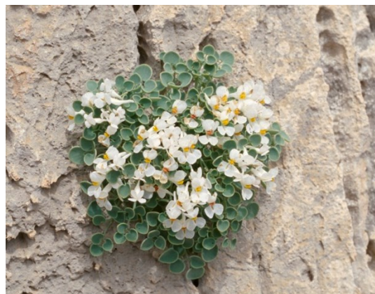
Los zapatitos de la virgen ( Sarcocapnos saetabensis ) medran en paredes verticales y sobre todo extraplomadas de las montañas de las comarcas centrales.