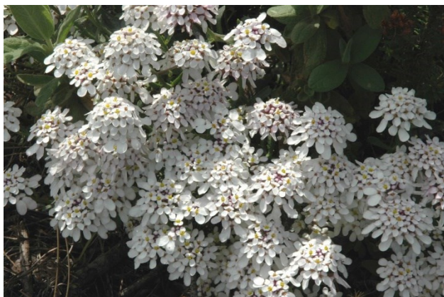
El carraspiques ( Iberis carnosae subsp. hegelmaieri ) es una planta propia de matorrales y pedregales de las montañas sudorientales de la península ibérica.