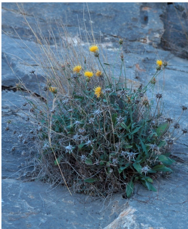
Centaurea saxicola és una espècie característica d'aquesta microreserva, que colonitza els penyals.

Teucrium buxifolium subsp. rivasii (E, R)