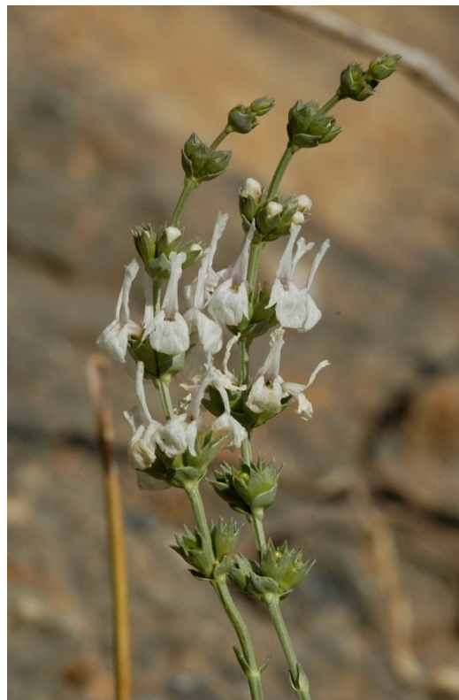
Sideritis glauca és un endemisme de les serres d'Orihuela, Callosa de Segura i àrees limítrofes de Múrcia que també creix en ambients rupícoles.